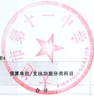
支出功能分类预算表